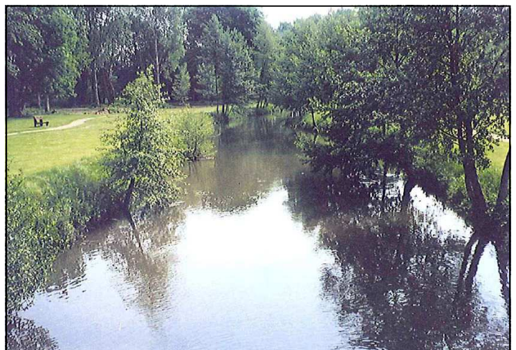
La Charentonne avant restauration en mai 2000

Mesures de restauration : les travaux sur ont consisté en une intervention sur l'ouvrage hydraulique alimentant le bras. Le vannage a été restauré afin d'assurer un débit minimum de 300l/s et une passe à poissons a été installée. Les travaux sur la morphologie ont débuté par une extraction et un stockage de la vase. Le lit mineur a ensuite été recréé et rehaussé pour accentuer la pente. Il a également été rétréci et reméandré avec l'installation de banquettes sur lesquelles la vase extraite du