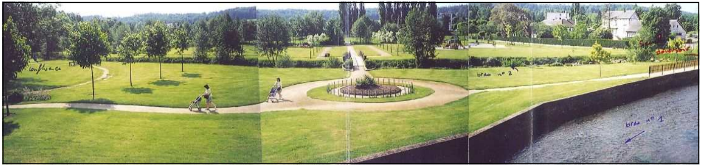
Les différents bras de la Charentonne dans le jardin public de la commune de Serquigny.