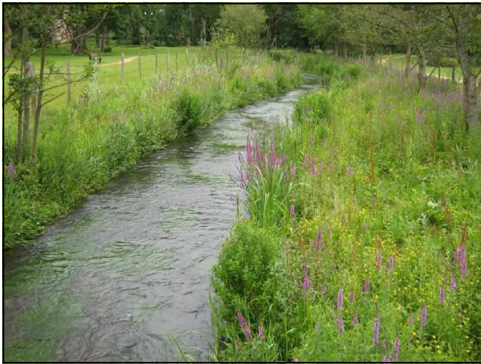
La Charentonne après restauration au printemps 2007

Objectifs de l'évaluation : l'objectif de l'évaluation porte sur les gains écologiques liés à la restauration du site. Il s'agit aussi pour les services du Conseil Général de l'Eure de conduire une réflexion sur les indicateurs à utiliser et sur l'éventuelle adaptation ou simplification des éléments existants.